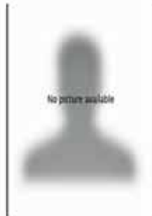
STEPHAN PERTRA LEHRERIN