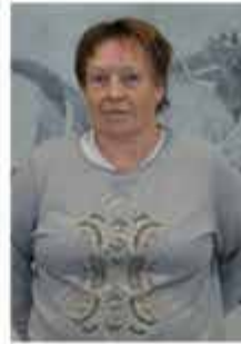
KEICHTER VALENTINA REINIGUNGSPERSONAL