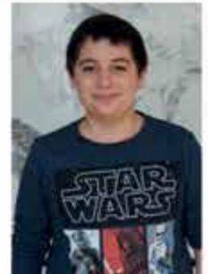
AKBASA OGUZ HAN