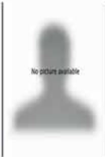
SALMAKNSPERGER SILVIA LEHRERIN