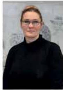
HEGELMANN ALONA REINIGUNGSPERSONAL