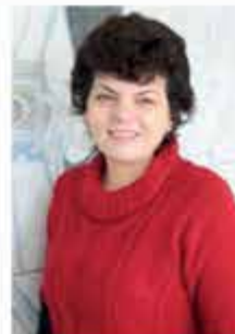
KISS LILIANA MITTAGSBETREUUNG