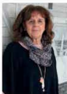
STOCKINGER MONIKA MITTAGSBETREUUNG