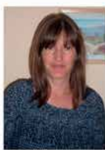
RIES MARION OGS